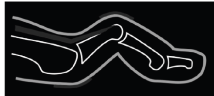
Figuur 2. Hamerteen